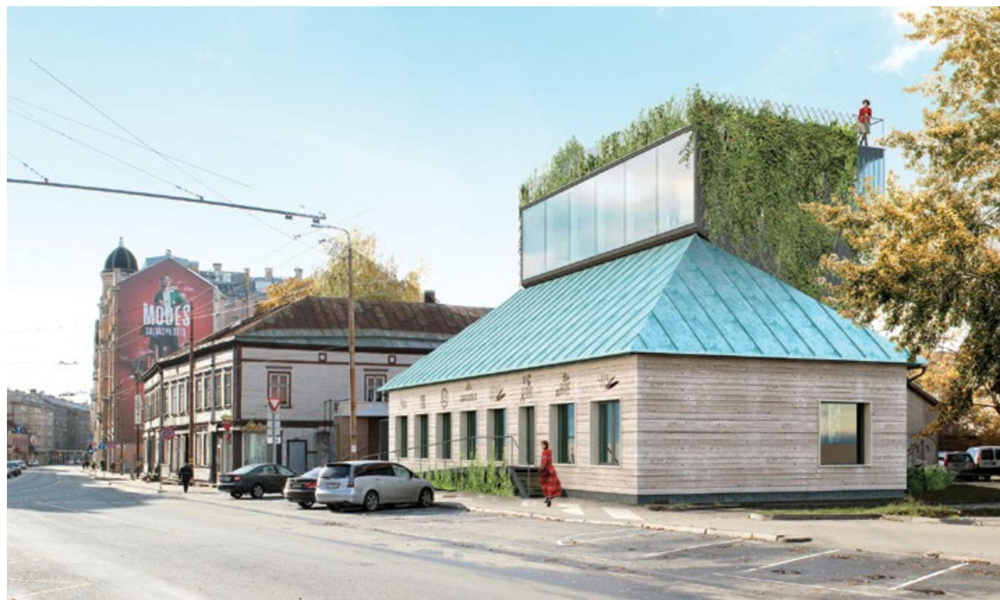
1. vieta, NRJA – skats uz «Gemoss» veikala-studiju no Jaunās Ģertrūdes baznīcas.

▲ Autori «Didrihsons arhitekti» – Brīvības ielas 111 fasāde.