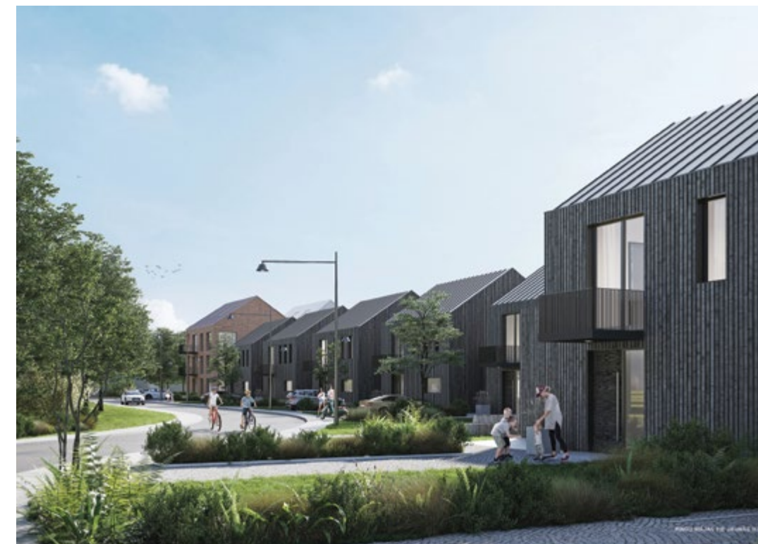
Dalīta 1. vieta, «RUUME arhitekti» – rindu mājas pie Jaunās ielas.

Konkursa materiālus apkopoja Dace Kalvāne, Mg. arch.